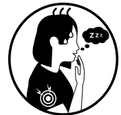
Fatigue extrême/inexpliquée ou douleurs musculaires (adultes de 18 ans ou plus)