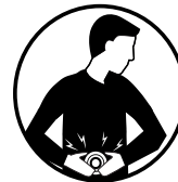
Nausées, vomissements ou diarrhée (enfants de moins de 18 ans)