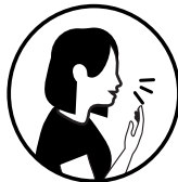
Toux ou toux aboyante (croup)