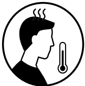
Fièvre ou frissons

Si le symptôme est causé par une maladie existante, répondez « non », à moins que le symptôme soit nouveau ou différent, ou qu'il s'aggrave.