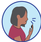
Toux ou toux aboyante (croup)