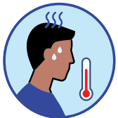
Fièvre ou frissons

Si le symptôme est causé par une maladie existante, répondez « non », à moins que le symptôme soit nouveau ou différent, ou qu'il s'aggrave.