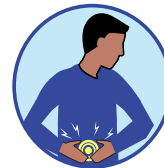
Nausées, vomissements ou diarrhée (enfants de moins de 18 ans)