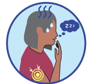
Fatigue extrême/inexpliquée ou douleurs musculaires (adultes de 18 ans ou plus)